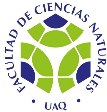
O-37-10 ORGANIGRAMA DE LA LICENCIATURA EN MICROBIOLOGÍA