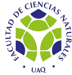
O-37-04 ORGANIGRAMA DE LA SECRETARIA ADMINISTRATIVA FACULTAD DE CIENCIAS NATURALES